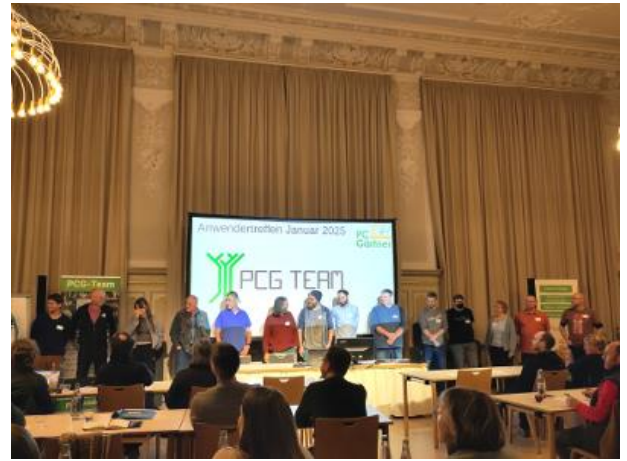
PCG Team Vorstellung, links geschwenkt bzw. rechts geschwenkt

Im Januar 2025 gab es wieder ein hybrides Anwendertreffen im Wildbad Rothenburg. Wie im Vorjahr waren ca. 100 Anwender:innen online und live dabei, wobei hier das PCG Team mit eingerechnet ist.